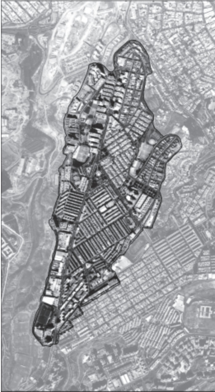
Figura 2. Área de estudio