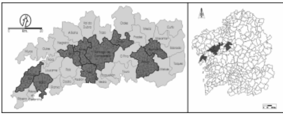
Figura 1. Espacio de referencia: mitad sur de la provincia de A Coruña

En cualquier caso, cada vez se realizan menos generalizaciones, y las que se hacen son sobre espacios concretos, ya que son muy poco válidas debido a la complejidad y a las numerosas interacciones de multitud de elementos que inciden en los fenómenos demográficos.